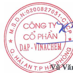
Vũ Văn Bằng

(Các thuyết minh từ trang 11 đến trang 42 là bộ phận hợp thành của Báo cáo tài chính này.)