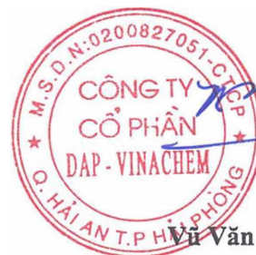
Vũ Văn Bằng

(Các thuyết minh từ trang 11 đến trang 42 là bộ phận hợp thành của Báo cáo tài chính này.)